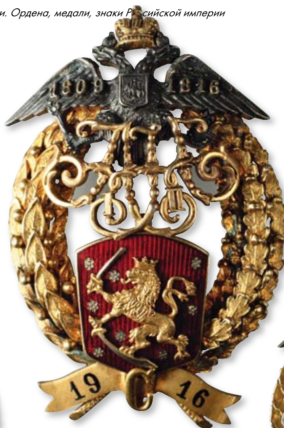
Увеличено в 1,5 раза