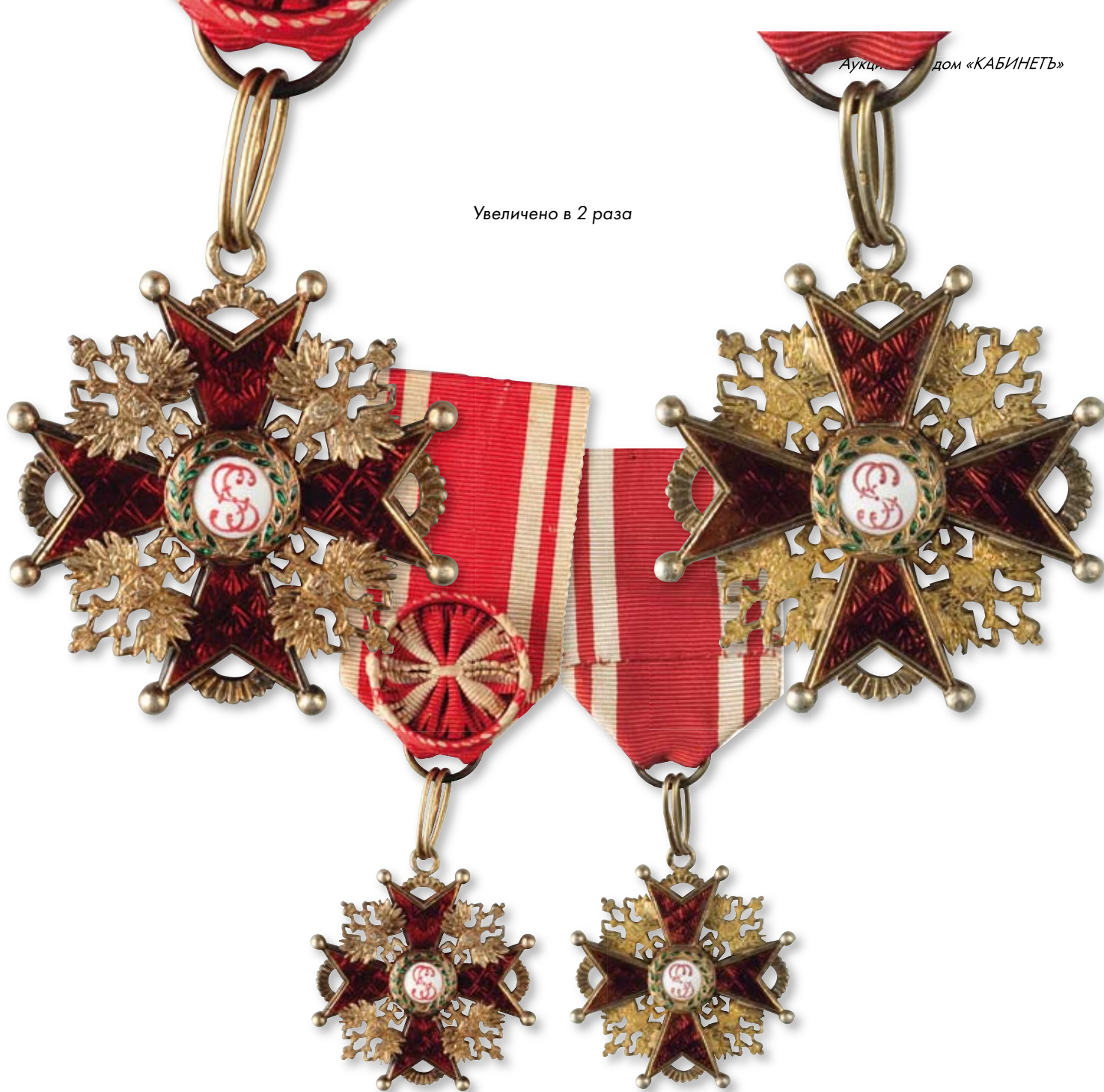
142 Знак ордена Святого Станислава 3-й степени Франция. Начало XX в. Размер 44 x 40 мм. Золото, эмаль

Клейма: на ушке и кольце – ромбовидное пробирное французское клеймо. На оборотной стороне на левом луче скол эмали