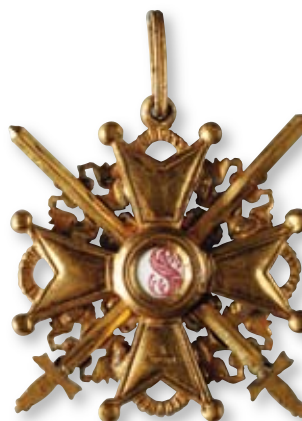
251 Знак ордена Святого Станислава 3-й степени с мечами Петроград, фирма «Эдуард». 1916–1917 гг. Размер 42 x 40 мм. Вес 15,7 г. Бронза, эмаль

Клейма: на оборотной стороне на нижнем луче – «К», развернутое клеймо «Эдуардъ»