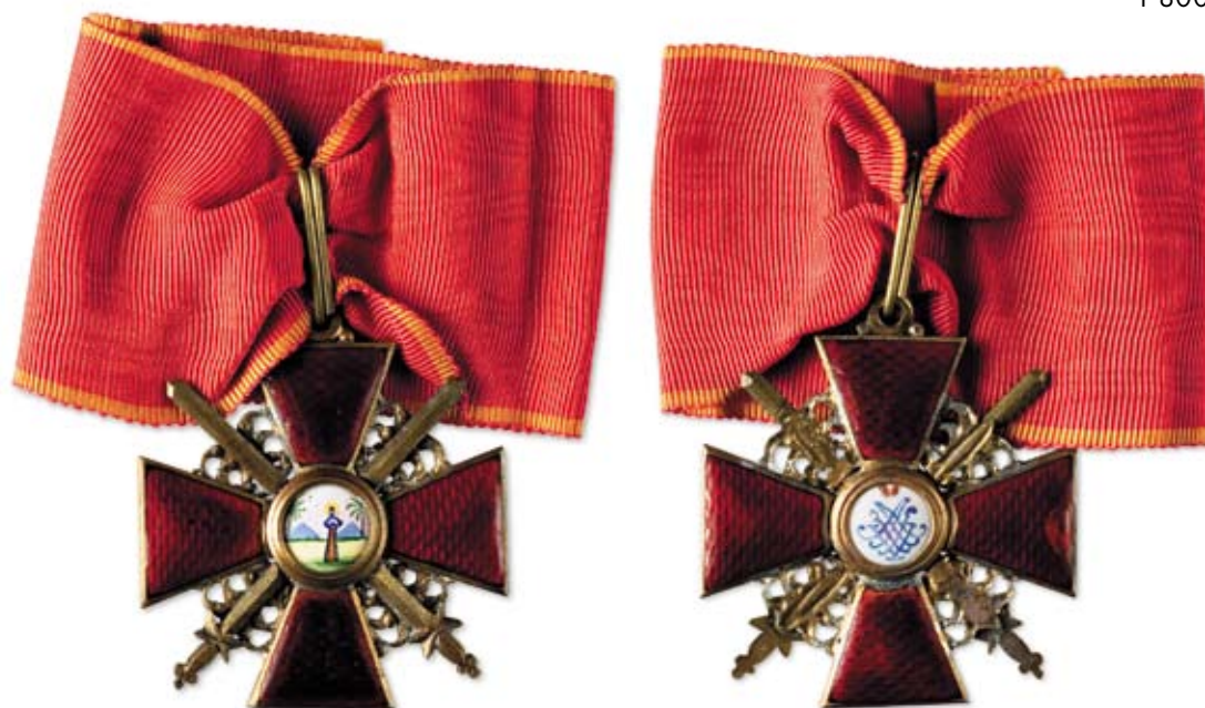
245 Знак ордена Святой Анны 2-й степени с мечами Петроград, мастерская Дмитрия Осипова. 1916–1917 гг. Размер 50 x 45 мм. Вес 19,5 г Бронза, эмаль, монтировка, муаровая лента

Клейма: на лицевой стороне под эмалью на нижнем луче – в прямоугольном щитке клеймо «К», именник «ДО».