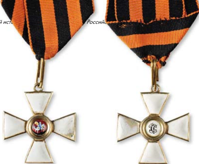
244 Знак ордена Святого Георгия 4-й степени Российская империя, частная мастерская. 1916–1917 гг. Размер 35 x 38 мм. Вес 14,8 г. Бронза, золочение, эмаль, муаровая лента

Скол эмали на правом луче на лицевой и оборотной сторонах.