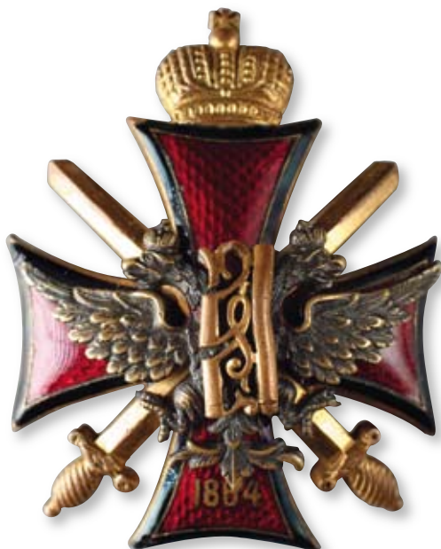
Увеличено в 1,5 раза