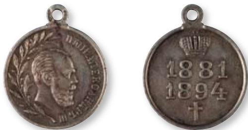
138 Медаль в память царствования императора Александра III Российская империя, частная мастерская Конец XIX – начало XX в. Диаметр 28 мм. Вес 12 г. Серебро

Клейма: на ушке с лицевой стороны – 84-й пробы.