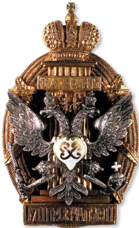
Увеличено в 2 раза