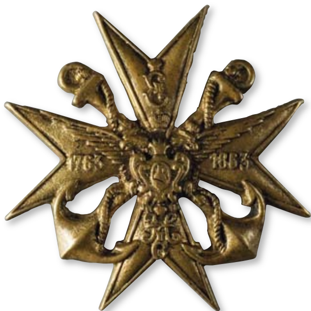
Увеличено в 2 раза