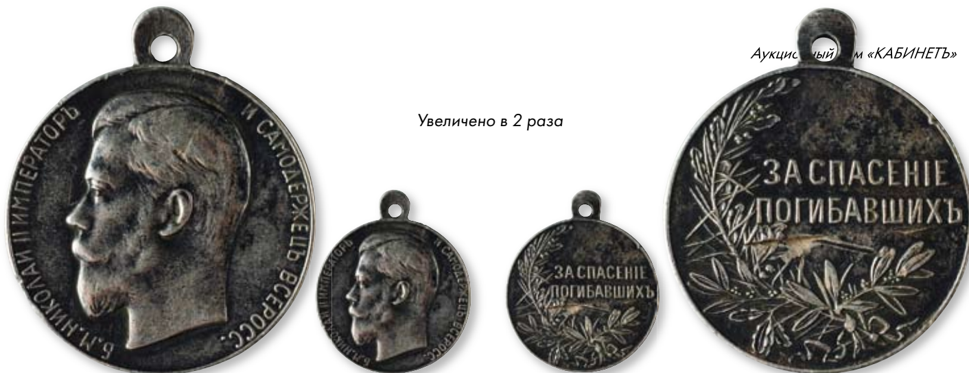
145 Медаль «За спасение погибавших» с портретом императора Николая II Санкт-Петербургский монетный двор. 1894-1904 гг. Диаметр 30 мм. Вес 16,9 г. Серебро

Утверждена 20 февраля 1834 г. для награждения граждан Российской империи за спасение людей во время пожаров, стихийных бедствий, за помощь утопающим, а также «за подвиги человеколюбия не при исполнении служебных обязанностей» с риском для собственной жизни.