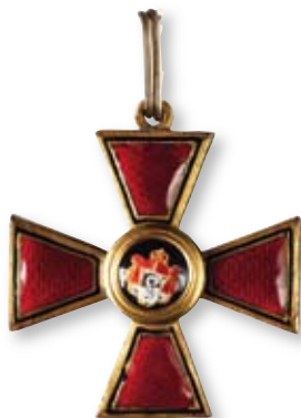
241 Знак ордена Святого Владимира 4-й степени Петроград, мастерская Дмитрия Осипова 1916–1917 гг. Размер 38 x 35 мм. Вес 9,6 г. Бронза, позолота, эмаль

Клейма: на оборотной стороне на нижнем луче под эмалью – «К», инициалы мастера «ДО».