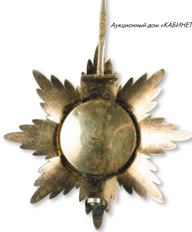
166 Звезда ордена Святого Станислава Санкт-Петербург, мастерская Альберта Кейбеля. 1899–1905 гг. Размер 86 x 86 мм. Вес 52,5 г. Серебро, эмаль

Клейма: на оборотной стороне – 84-й пробы с женской головкой, повернутой влево, императорский орел, развернутое клеймо «Keibel»; на булавке — развернутое клеймо «Keibel», знак удостоверения.