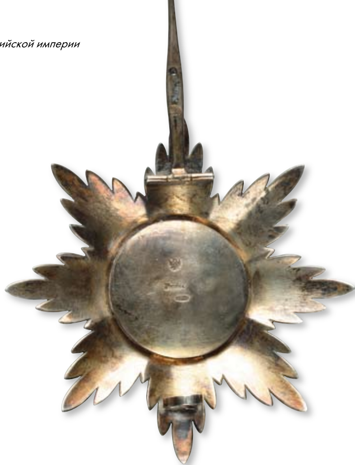
137 Звезда ордена Святой Анны Санкт-Петербург, мастерская Альберта Кейбеля. 1899–1903 гг. Размер 91 x 91 мм. Вес 52,4 г. Серебро, эмаль, монтировка

Клейма: на оборотной стороне на медальоне – императорский орел, развернутый именник «Keibel», 84-й пробы с женской головкой в кокошнике, повернутой влево, и с инициалами пробирного мастера «ЯЛ» (Яков Ляпунов); на заклочке – императорский орел, развернутый именник «Keibel», 84-й пробы с женской головкой в кокошнике, повернутой влево, и с инициалами пробирного мастера «ЯЛ» (Яков Ляпунов), знак удостоверения.