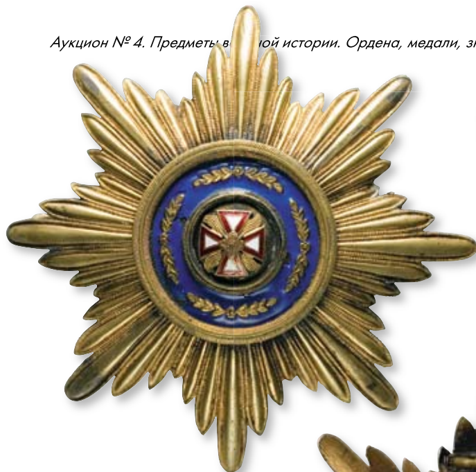
240 Звезда ордена Белого Орла Петроград, фирма «Эдуард». 1917 г. Размер 90 x 90 мм. Вес 61,7 г. Латунь, эмаль, монтаж

Клейма: на оборотной стороне – «К» и развернутое клеймо «Эдуард».