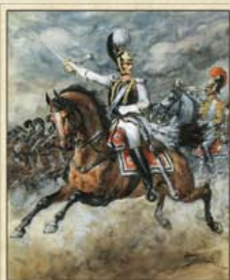
Шилов П. Д. Кавалерийская атака (Бародино) Бумага, акварель, Л. 62,3х48,8. ГРМ

119049, Москва, Крымский вал, дом 10, Центральный дом художника, зал А 1.