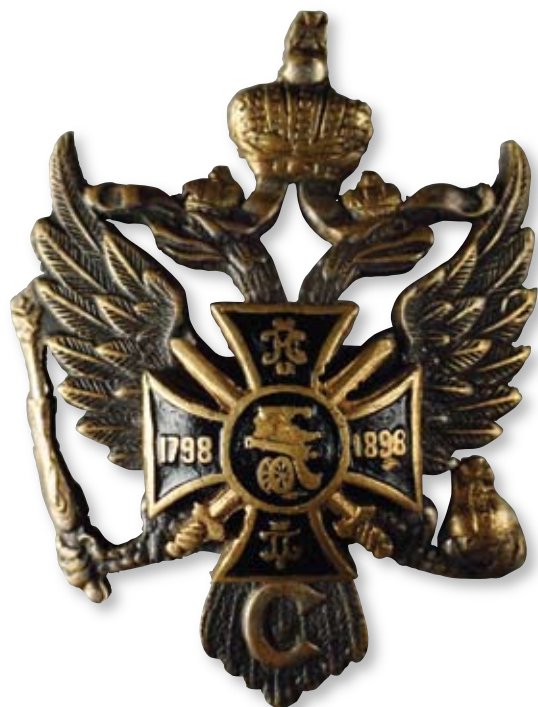
Увеличено в 2 раза