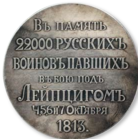
202 Медаль «В память 22 000 русских воинов павших в бою под Лейпцигом» Товарищество «Хлебников и сыновья». 1913 г. Диаметр 70 мм. Вес 197,6 г. Серебро

Клейма: на гурте – Московского пробирного управления 91-й пробы с женской головкой в кокошнике, повернутой вправо, развернутый именник «Хлебниковъ», императорский орел – клеймо поставщика Двора Е. И. В.