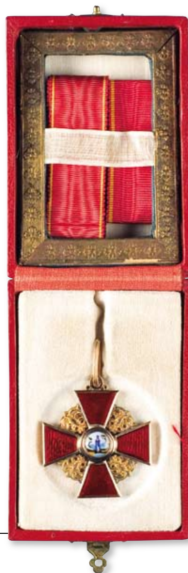
168 Знак ордена Святой Анны 3-й степени Санкт-Петербург, мастерская Альберта Кейбеля 1899–1905 гг. Размер 40 x 35 мм. Вес 8,2 г. Золото, эмаль

Клейма: на оборотной стороне на ушке – 56-й пробы с женской головкой в кокошнике, повернутой влево и инициалами пробирного инспектора «ЯЛ» (Яков Ляпунов); под эмалью на верхнем луче – императорский орел, на нижнем луче – именовник «АК».