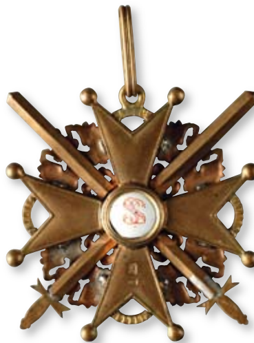
250 Знак ордена Святого Станислава 2-й степени с мечами Петроград, мастерская Дмитрия Осипова. 1916–1917 гг. Размер 49 x 49 мм. Вес 20,9 г. Бронза, позолота, эмаль

Клейма: на оборотной стороне на нижнем луче – «К», именник «ДО».