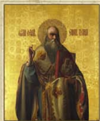
Абрам-Лазарев С. Д. Св. Василий Персидский, 1863. Холст, масло; 239х115 см. Пермская художественная галерея