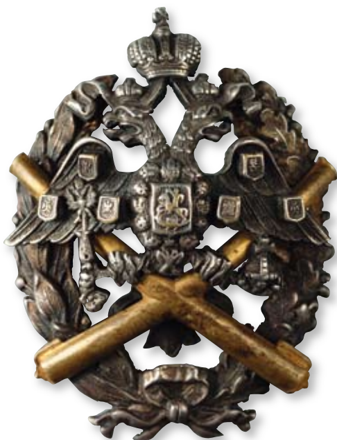
Увеличено в 1,5 раза