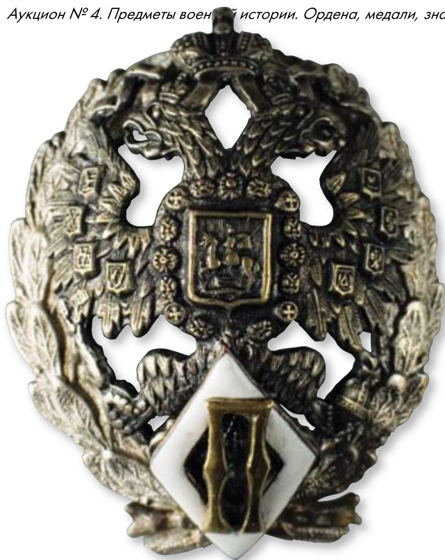
Увеличено в 2 раза