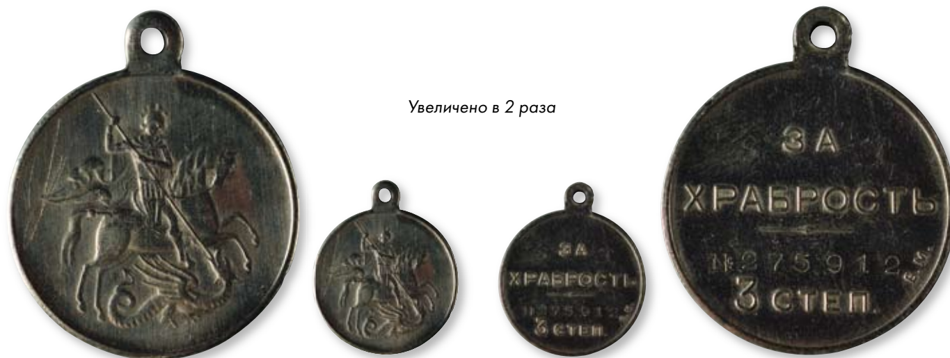
238 Медаль «За храбрость» 3-й степени № 275912 Гравер: А.Ф. Васютинский Петроградский монетный двор. 1917 г. Диаметр 28 мм. Вес 13 г. Белый металл

Медаль была введена приказом по Военному и Морскому ведомствам 24 апреля 1917 г. Награждались медалью нижние чины армии и флота, уже награжденные раньше медалью «За храбрость», за повторное проявление личной храбрости и доблести.