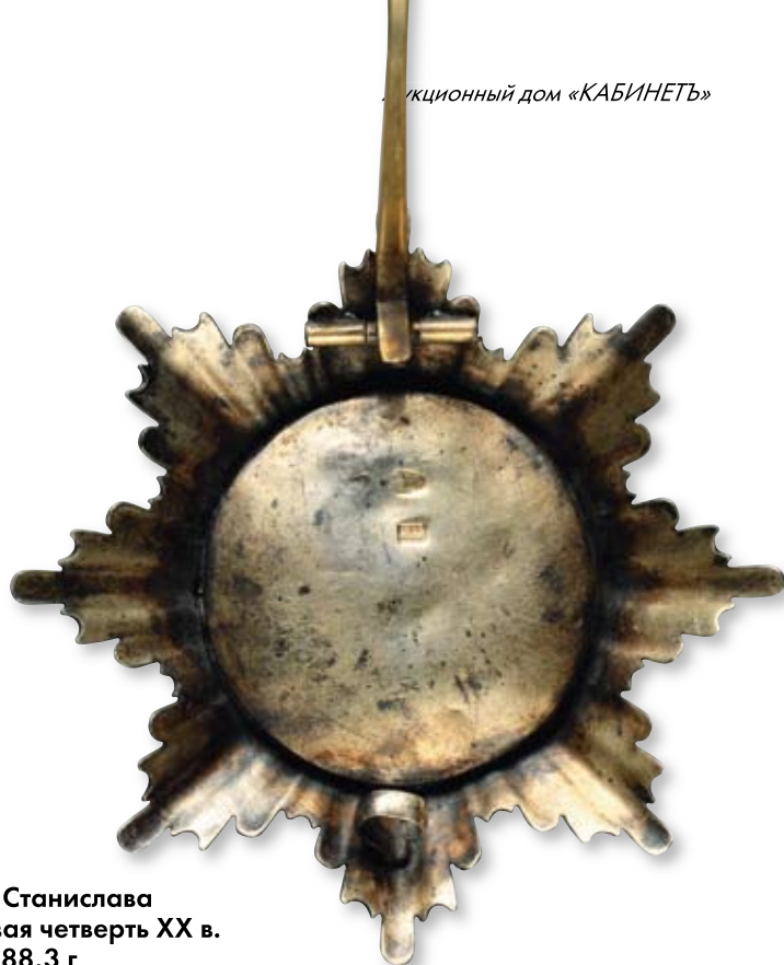
169 Звезда ордена Святого Станислава Западная Европа. Первая четверть XX в. Размер 92 x 92 мм. Вес 88,3 г Серебро, позолота, эмаль

Клейма: на оборотной стороне проставлены в позднейшее время.