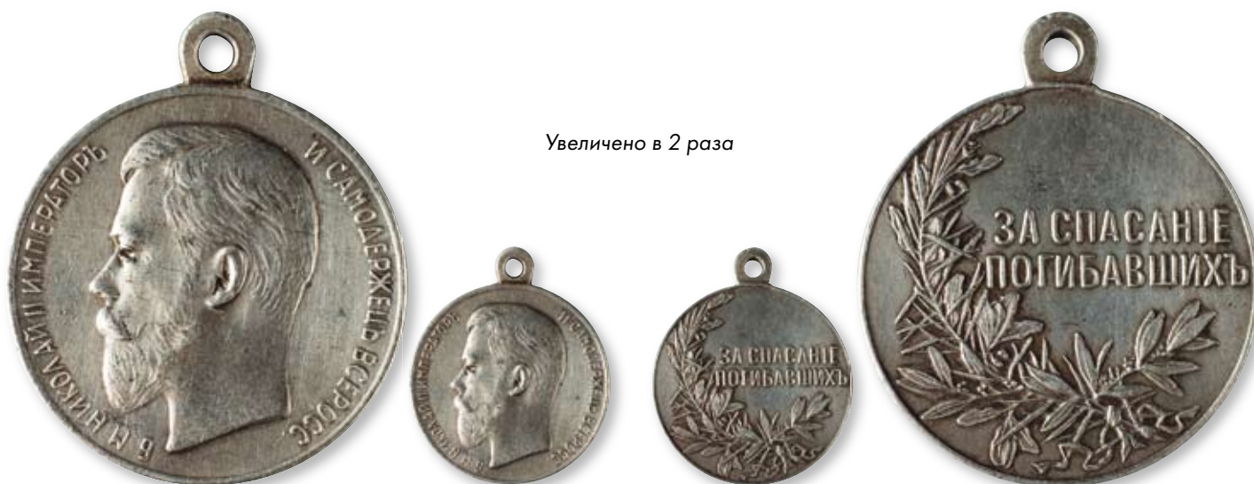
146 Медаль «За спасение погибавших» с портретом императора Николая II Санкт-Петербургский монетный двор. После 1904 г. Диаметр 30 мм. Вес 18 г. Серебро

12 февраля 1904 г. по «высочайшему повелению» императора Николая II было изменено название медали «За спасение погибавших» утвержденной еще в 1834 г. Условия награждения оставались прежним.