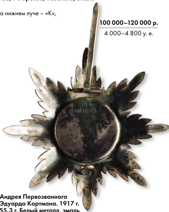
243 Звезда ордена Святого Андрея Первозванного Петроград, мастерская Эдуарда Кортмана. 1917 г. Размер 93 x 90 мм. Вес 55,3 г. Белый металл, эмаль

Клейма: на оборотной стороне – развернутое клеймо «Э.КОРТМАНЪ»; на булавке – развернутое клеймо «Э.КОРТМАНЪ».