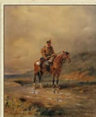
Бильдерлинг А. А. У дороги. Бумага, акварель, 36,3х28,4 см. в свету. Частная коллекция