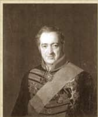
Абрам-Лазарев Семён Давыдович (1816–1885) Князь, генерал-майор в отставке, художник Императорской Академии художеств