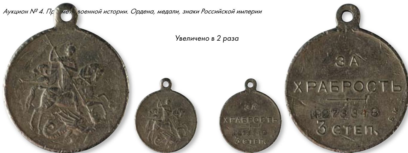
237 Медаль «За храбрость» 3-й степени № 273348 Гравер: А.Ф. Васютинский Петроградский монетный двор. 1917 г. Диаметр 28 мм. Вес 12,8 г. Белый металл