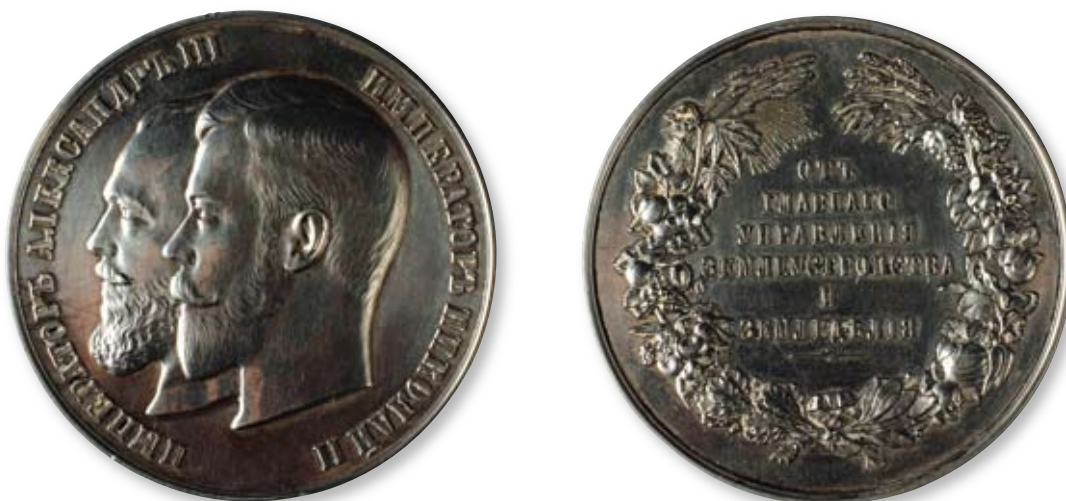
123 Медаль «Главного управления земледелия и землеустройства» Российская империя, частная мастерская. 1910 г. Диаметр 65 мм. Вес 135,1 г. Серебро