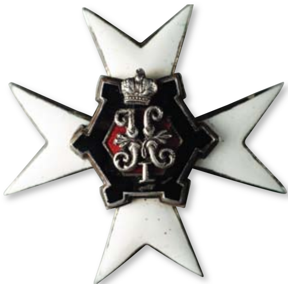
Увеличено в 2 раза