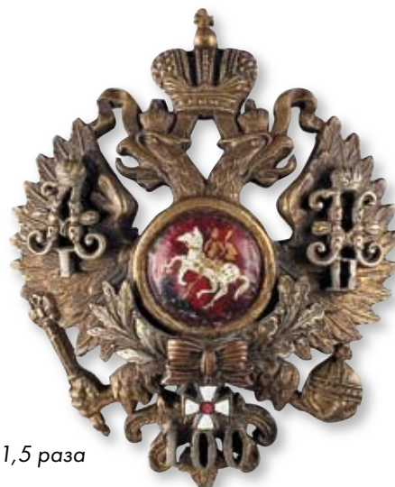
Увеличено в 1,5 раза