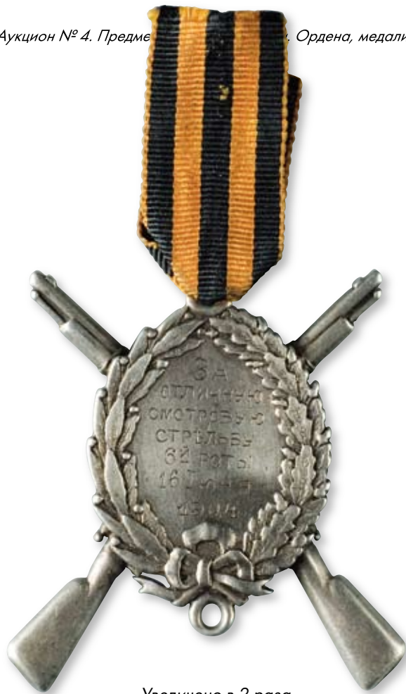
Увеличено в 2 раза