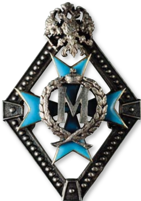
Увеличено в 2 раза