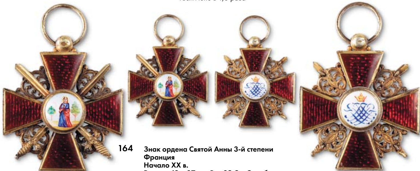
164 Знак ордена Святой Анны 3-й степени Франция Начало XX в. Размер 42 x 37 мм. Вес 29,9 г. Серебро, позолота, эмаль, монтировка

Клейма: на лицевой стороне на ушке – французское пробирное клеймо.