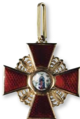
Увеличено в 2 раза