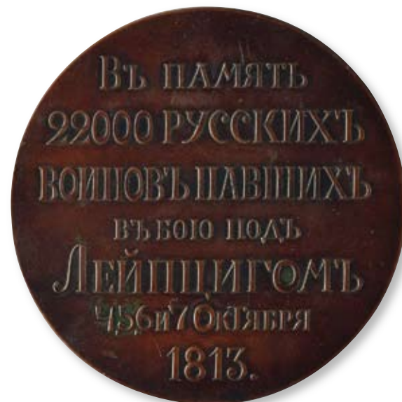
203 Медаль «В память 22 000 русских воинов, павших в бою под Лейпцигом» Товарищество «Хлебников и сыновья». 1913 г. Диаметр 75 мм. Вес 169 г. Медь