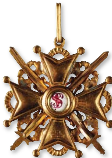
242 Знак ордена Святого Станислава 2-й степени с мечами Петроград, фирма «Эдуард». 1917 г. Размер 53 x 49 мм. Вес 26,4 г. Бронза, позолота, эмаль

Клейма: на оборотной стороне на нижнем луче – «К», развернутое клеймо «Эдуард».