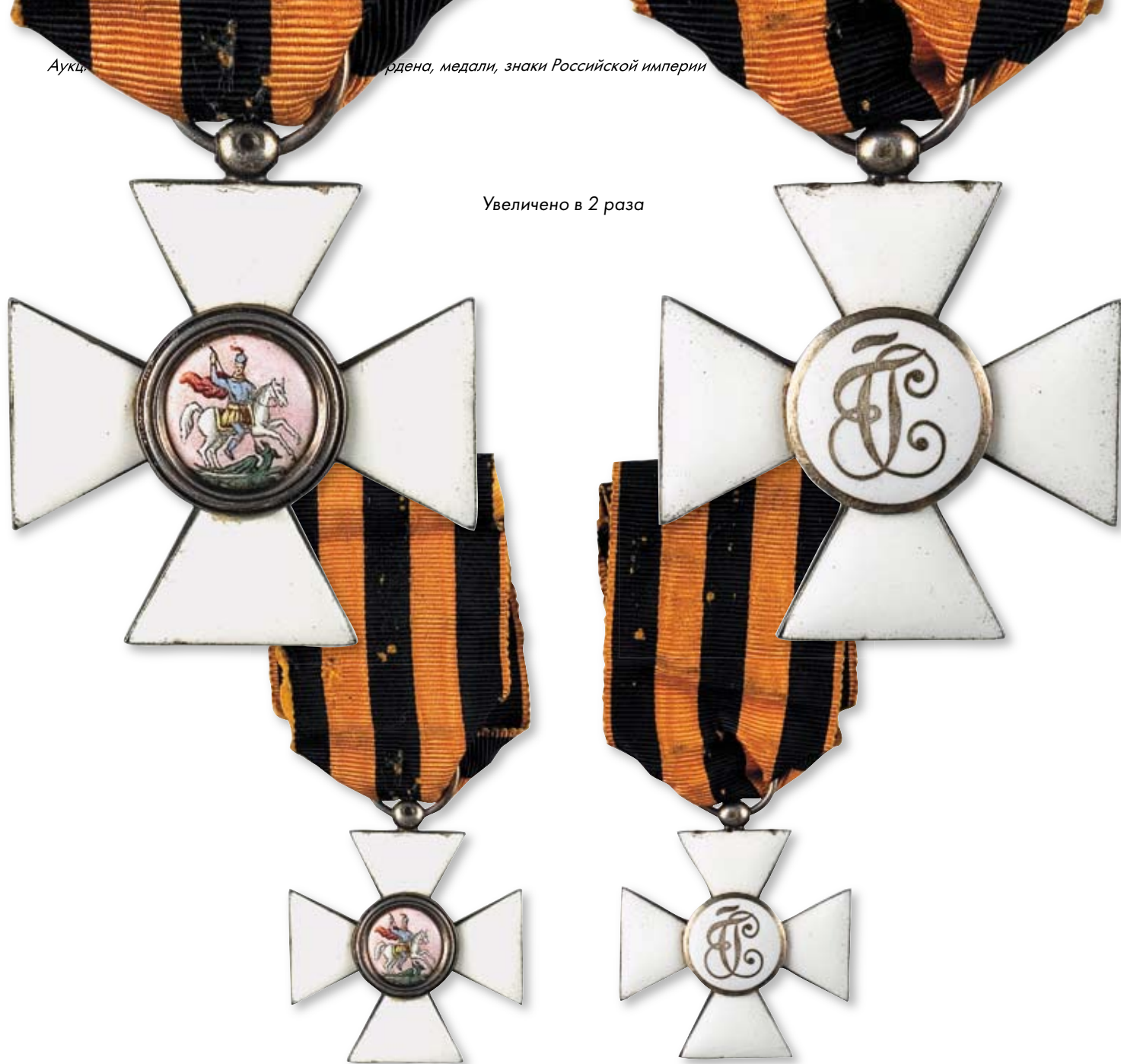
165 Знак ордена Святого Георгия 4-й степени на оригинальной ленте Западная Европа. Начало XX в. Размер 41 x 41 мм. Серебро, эмаль, муаровая лента