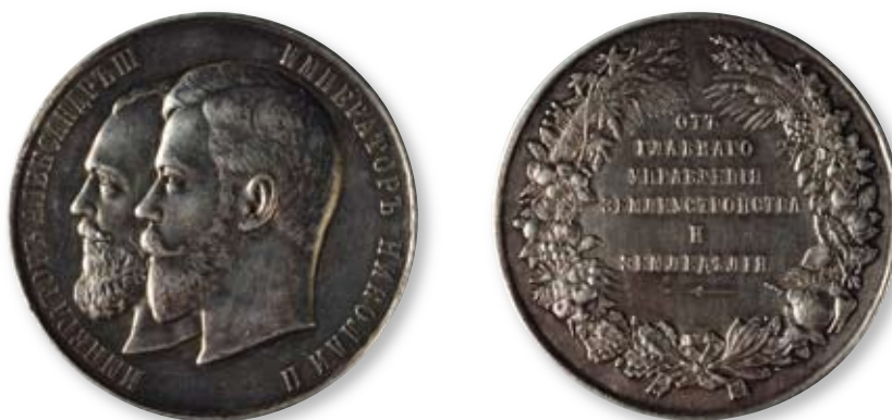
122 Медаль «Главного управления земледелия и землеустройства» Санкт-Петербургский монетный двор. Начало XX в. Диаметр 50 мм. Вес 61,9 г. Серебро