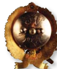
167 Знак об окончании Санкт-Петербургского Практического Технологического Института Императора Николая I (образца 1896 г.), уменьшенного размера Санкт-Петербург, частная мастерская Конец XIX в. Размер 29 x 25 мм. Вес 9,2 г. Золото

Клейма: на лицевой стороне – 56-й пробы. На гайке надпись: «18 1/XII 96 А. С.»