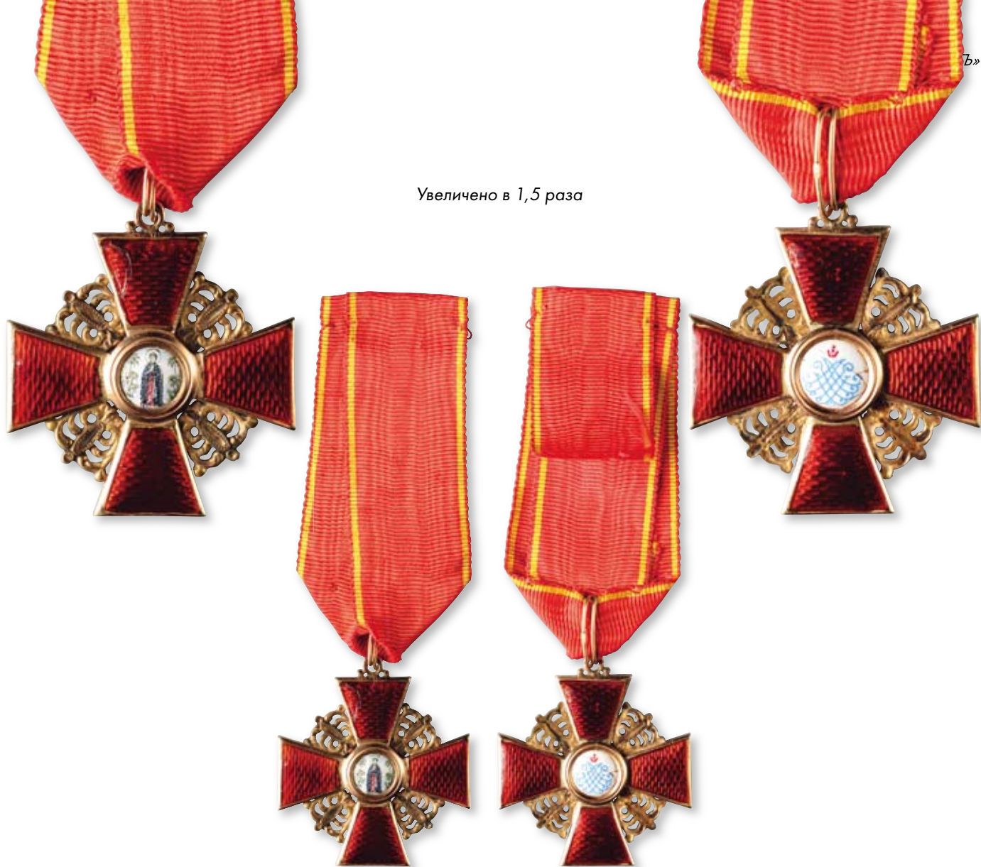
175 Знак ордена Святой Анны 3-й степени Санкт-Петербург, фирма «Эдуард». 1905–1908 гг. Размер 40 x 36 мм. Вес 8,8 г. Золото, эмаль

Клейма: на оборотной стороне на ушке – 56-й пробы; под эмалью на верхнем луче – именник «ИЛ», на нижнем – развернутое клеймо «Эдуард».