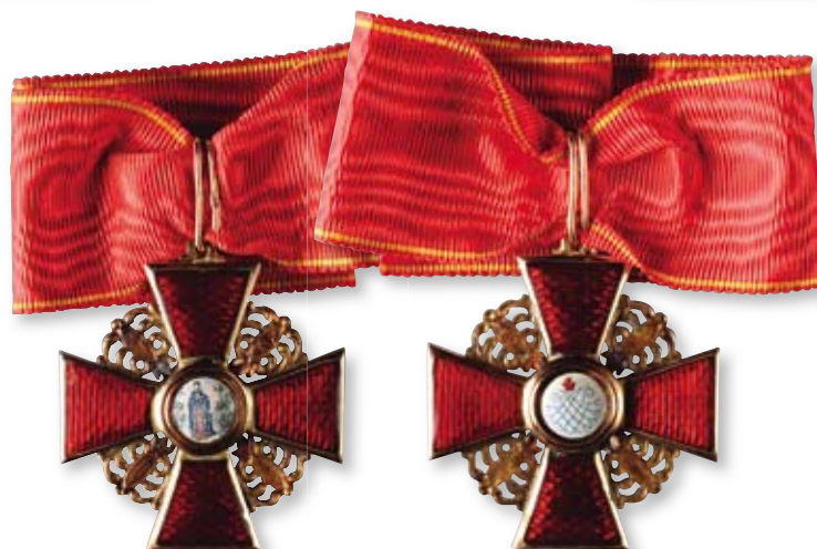
179 Знак ордена Святой Анны 3-й степени Санкт-Петербург, фирма «Эдуард». 1908–1917 гг. Размер 40 x 35 мм. Вес 8,5 г. Золото, эмаль, муаровая лента

Клейма: на лицевой стороне на ушке – импортное ввозное в виде раковины, на решетках и верхней серьге знаки удостоверения; на оборотной стороне на ушке – 56-й пробы (не читается), под эмалью на верхнем луче – инициал «ВД».